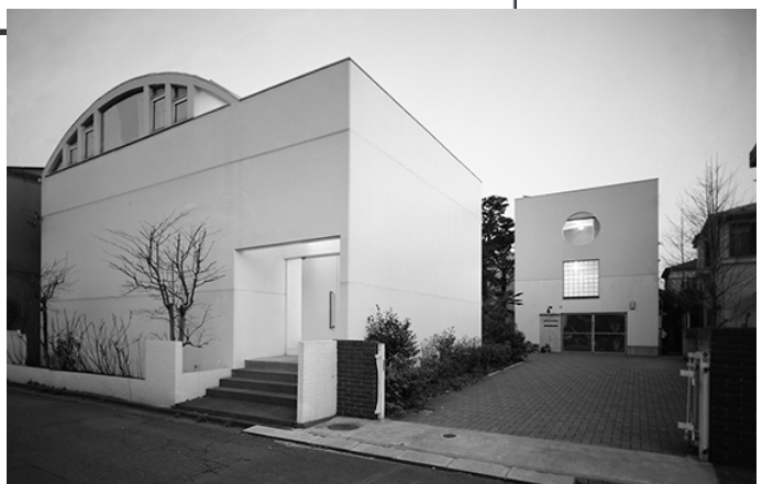
宇フォーラム美術館 外観 (会場に駐車場はございません)