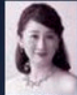
ソプラノ 澤江衣里