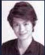
バリトン 加来 徹